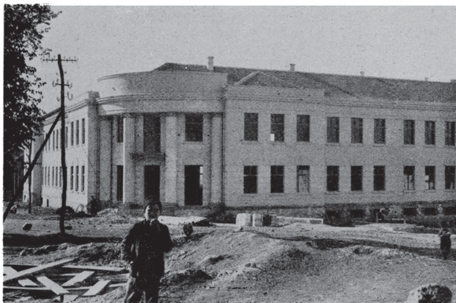
Гимназиска зграда сазидана у Призрену 1933 год.